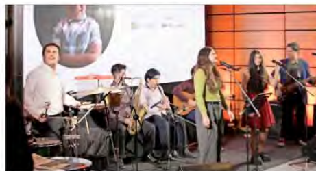
Clásicos de Stevie Wonder, Ana Tijoux y Víctor Jara interpretó la orquesta Eleva Inclusión Musical, que entre sus miembros incluye a jóvenes con discapacidades.