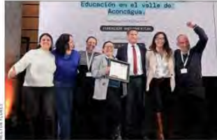
Durante la premiación, el equipo resaltó la importancia de mejorar la participación social y comunitaria de los estudiantes.

En específico, el Modelo Pionero, que ya se ha implementado en las provincias de San Felipe y Los Andes, busca expandirse a todas las escuelas públicas de la comuna de Panquehue, en la Región de Valparaíso.