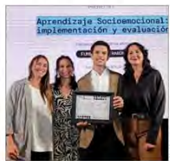
Gracias a los fondos recibidos, el proyecto ahora espera impactar a más de 50 mil estudiantes.