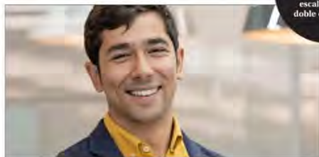
GERENTE DE PROGRAMAS EN WISE

Para el especialista, uno de los grandes retos del sistema es promover iniciativas que “sean escalables y sostenibles en el tiempo”.