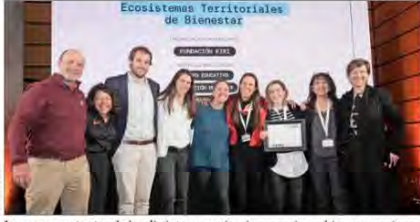
Los representantes de las distintas organizaciones socias subieron emocionados con una serie de desafíos a nivel país, siendo esto especialmente crítico en comunas con altos niveles de ruralidad, advierten los gestores de "Puentes Educativos TP", quienes mencionan problemas de liderazgo a nivel directivo, poca formación docente en metodologías innovadoras pertinentes a cada especificidad, así como baja titulación y expectativas post egreso en los estudiantes.