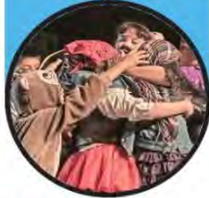
En la foto, alumnos de 3° básico del colegio Bélgica presentándose en el Centro Cultural Espacio Matta de La Granja.