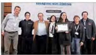
Recart señala que la alianza con Pulso Escolar es clave para levantar evidencia y generar mejoras continuas.

Al instalar computadores e internet, su buen uso y poder así formar en aprendizajes claves, es van desde la alfabetización digital a la lectura y las operaciones matemáticas.